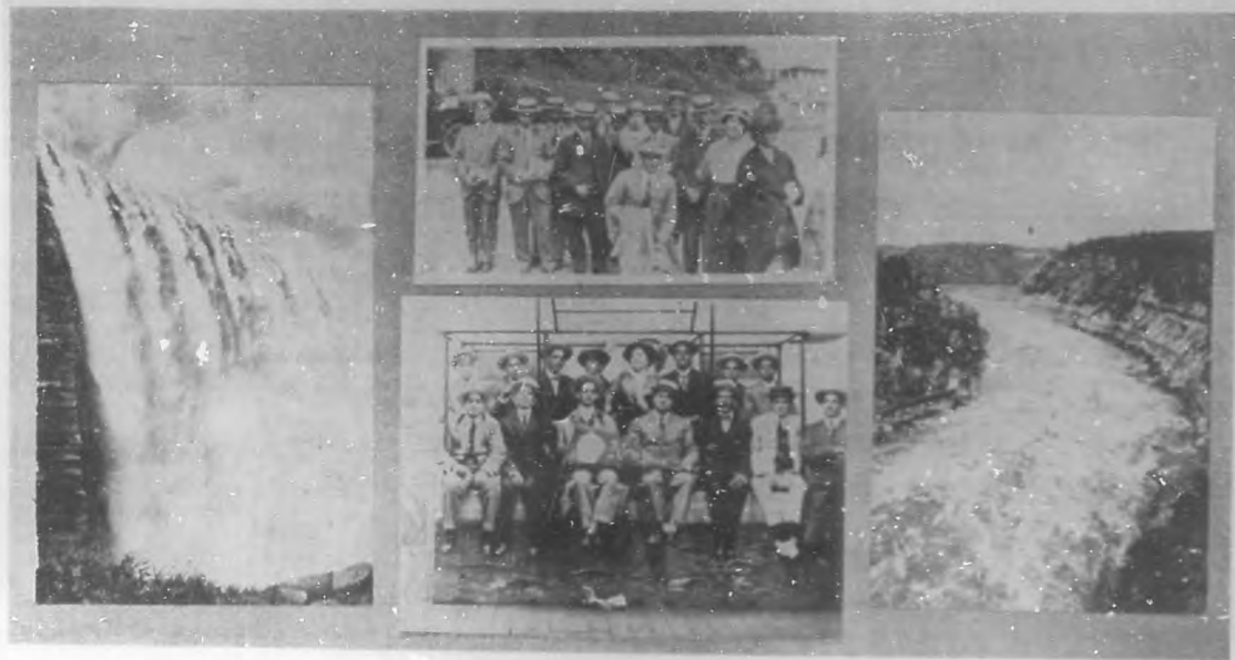
La excursión al Niágara.—Panorama de las Cataratas del Niágara. Los excursionistas en las cataratas. Grupo de excursionistas en Coney Island. Los rápidos Canadenses.

Excursión al Niágara. —En la pasada semana regresaron los excursionistas del primer viaje de recreo organizado por la "Ward Line" de la Habana a los Estados Unidos.