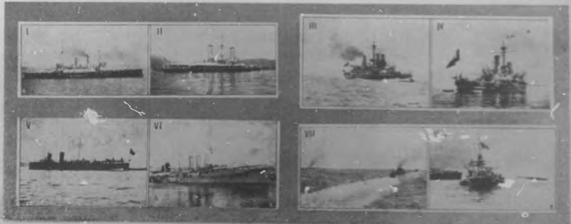
La Guerra Europea.— Marina de guerra italiana. 1.— Regina Margherita. 2.— Emanuele Filiberto. 3.— Sardegna. 4.— Saint Bon. 5.— Duino. 6.— Regina Elena. 7.— Escuadra de caza torpedos. 8.— Maniobra de hacer un torpedero.

plantes, pero amosándonos el cable el carta que va tomando la posición de Italia que se convulsiona ante la presión formidable de las naciones en lucha, hemos preferido dar esta información que da idea de su flota y de la preparación y calidad de su ejército.