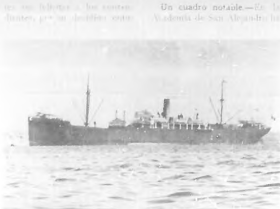
Vapor "Hudson" que conduce a Francia a los trescientos reservistas patriotas, que hacen el viaje llenos de entusiasmo.

Las regatas del Varadero. — La pasada semana finalizó una fiesta por demás simpática para todos los amantes del Sport, que por lo que hemos podido ver son muy buenas, en primer lugar. El hermoso puerto de Varadero resultaba muy cómodo para albergar aquella multitudinaria reunión, en la que de la Capital de la República, Matanzas y Cardenas, vino de todas partes de la Isla que le gusta a Cardenas. El hermoso puerto de Varadero resultaba muy cómodo para albergar aquella multitudinaria reunión, en la que de la Capital de la República, Matanzas y Cardenas, vino de todas partes de la Isla que le gusta a Cardenas. El hermoso puerto de Varadero resultaba muy cómodo para albergar aquella multitudinaria reunión, en la que de la Capital de la República, Matanzas y Cardenas, vino de todas partes de la Isla que le gusta a Cardenas.