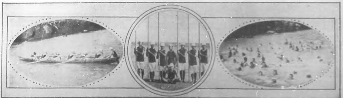
Canoa y remeros del Club Atlético del Regimiento núm. 2 de infantería destacada en Matanzas, que tomaron parte en las regatas de Varadero. Balistas del expresado Regimiento.