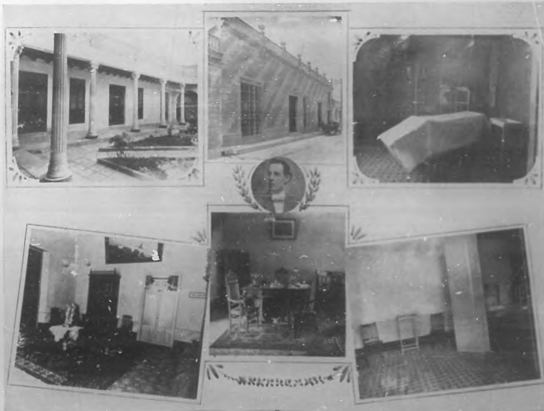
Clinica del Dr. Ramón V. Guerrero en Camaguey. — Vista del patio de la clínica. Aspecto pintoresco de la fachada del edificio donde está instalada la clínica. Sala de operaciones. Salón de espera. Despacho de consultas. Otra sala de operaciones.

posible de la medicina y la quimioterapia de esta calidad, tan prácticas, que en ellas hay que ir, a la apreciación de su importancia y de su eficacia, enjuiciando por el resultado de la aplicación o intervención. Y en casos lo que se llama lo fortuito en la ciencia, como en otros es