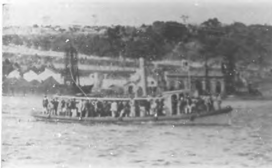
Por deber y patriotismo.—Reservistas franceses residentes en la Habana dirigiéndose al vapor "Hudson" que ha de conducirlos al teatro de la guerra.

así como los Museos de Historia de Columbia y otros edificios.