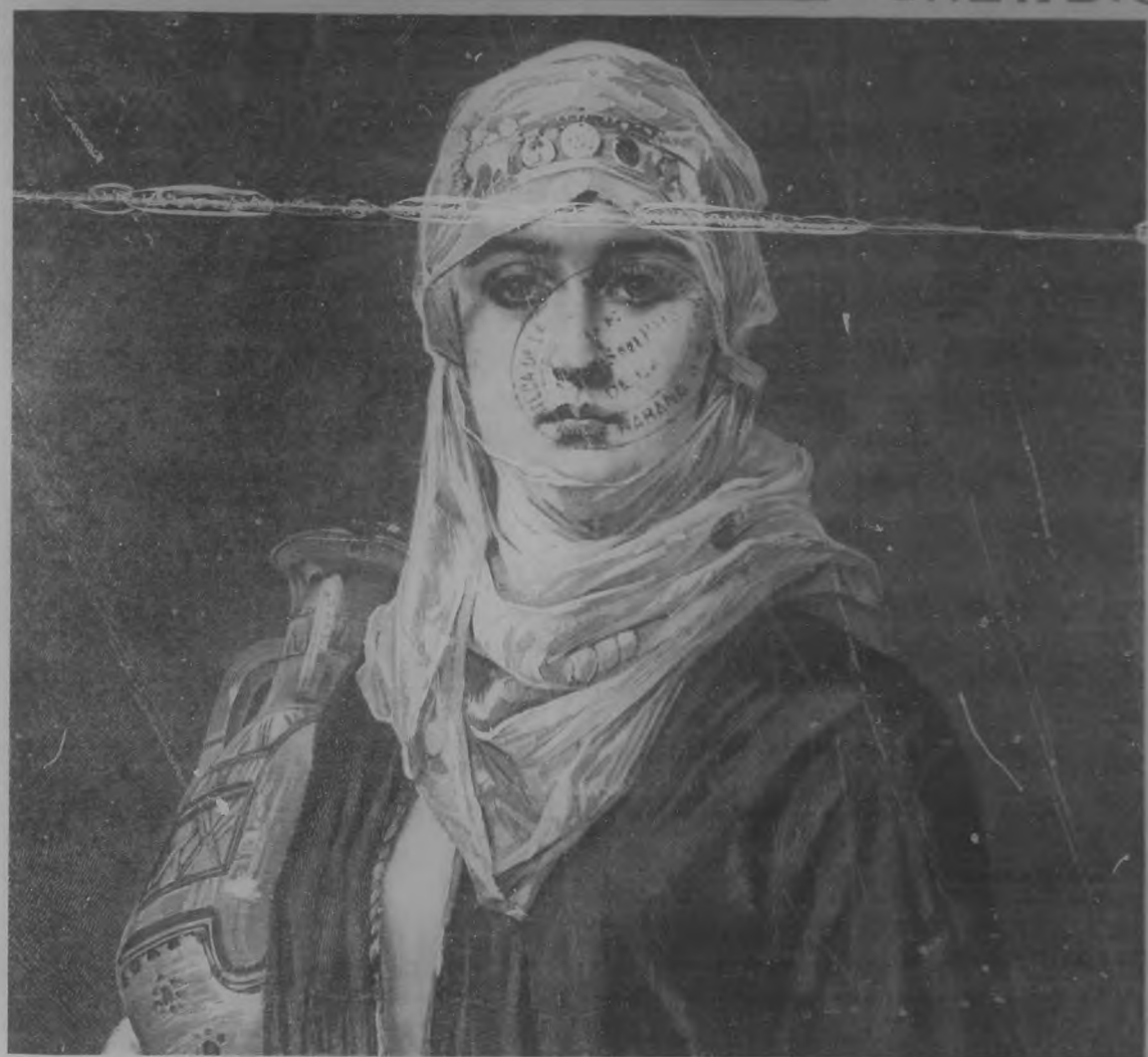
AGAR.—Cuadro por N. Sichel. (Grabado por G. Stadelmann).