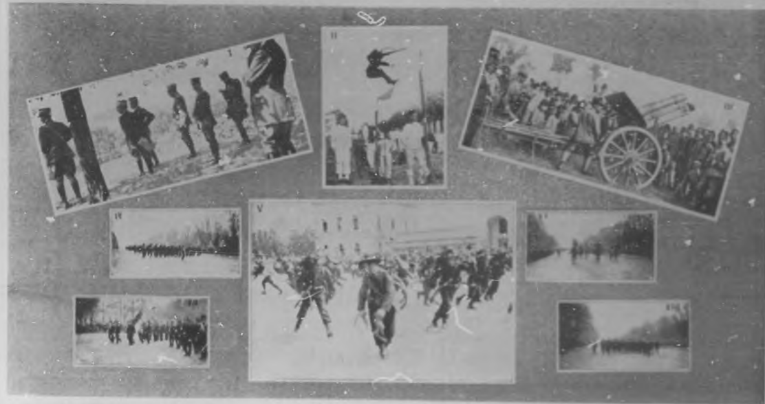
La Guerra Europea. 1.— El rey Victorio Emanuele presenciando las maniobras del ejército italiano. 2.— Tormenta de aviones con su equipo efectuando ejercicios de salto. 3.— Cañón contra aeroplanos del ejército italiano. 4.— Destro del 4.º regimiento de Bersaglieri. 5.— Cazadores italianos del cuerpo de ciclistas, efectuando ejercicios de destreza. 6.— El General Bazzani pasando revista. 7.— Destro de la infantería italiana. 8.— Infantería a marcha forzada.

A guerra europea.— Con vivos esfuerzos quiere el rey de Italia mantener la neutralidad en el conflicto de las naciones, interpretando los sentimientos del pueblo. No ha de poder conseguirlo por el decidido empeño con que a